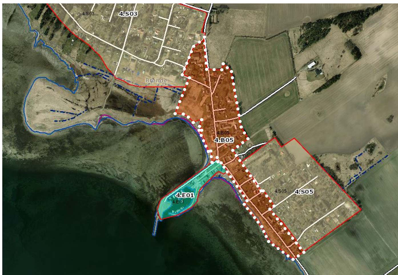
Eksisterende og fremtidig rammeafgrænsning for 4.B05

Indhold i eksisterende rammebestemmelser for 4.B05