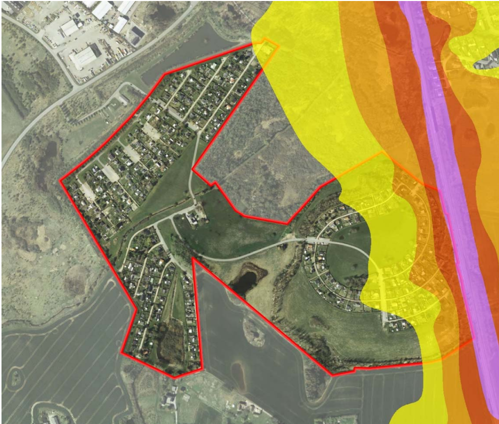
5 Kort med støjvirkninger fra jernbanestøj 1,5m