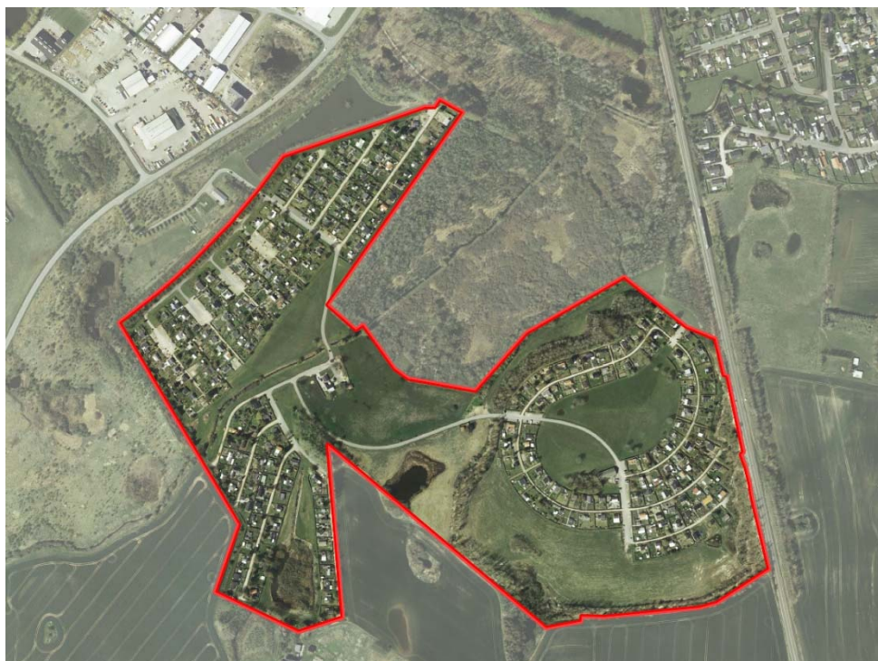
1 Kort over Lokalplanområde

Planområdet ligger i landzone, mere specifikt sydøst for Holbæk by. Den gældende lokalplan på området er Lokalplan nr. 30, der udlægger anvendelsen til kolonihavebrug. Geografisk er industrivirksomheden Pharma Cosmos beliggende nordvest for området, som ellers er omgivet af landbrugsjord og beskyttet natur – herunder fredskov. Øst for området er der en jernbanestrækning, som i Kommuneplanen 2017 muliggøre et fremtidigt boligområde på den anden side af jernbaneterrænet. Planområdet fremstår i dag åbent og grønt, med store naturområder og rekreativt areal. Arealet ca. 353.000 m 2 stort er beliggende på matr.numre: 1d, 1f, 1k, 1l, 1s, 1q, St. Grandløse, Grandløse, 4d, 4f, 4g, 4h, 4i, Ll. Grandløse By, Grandløse, 7b Tåstrup, Holbæk Jorder.