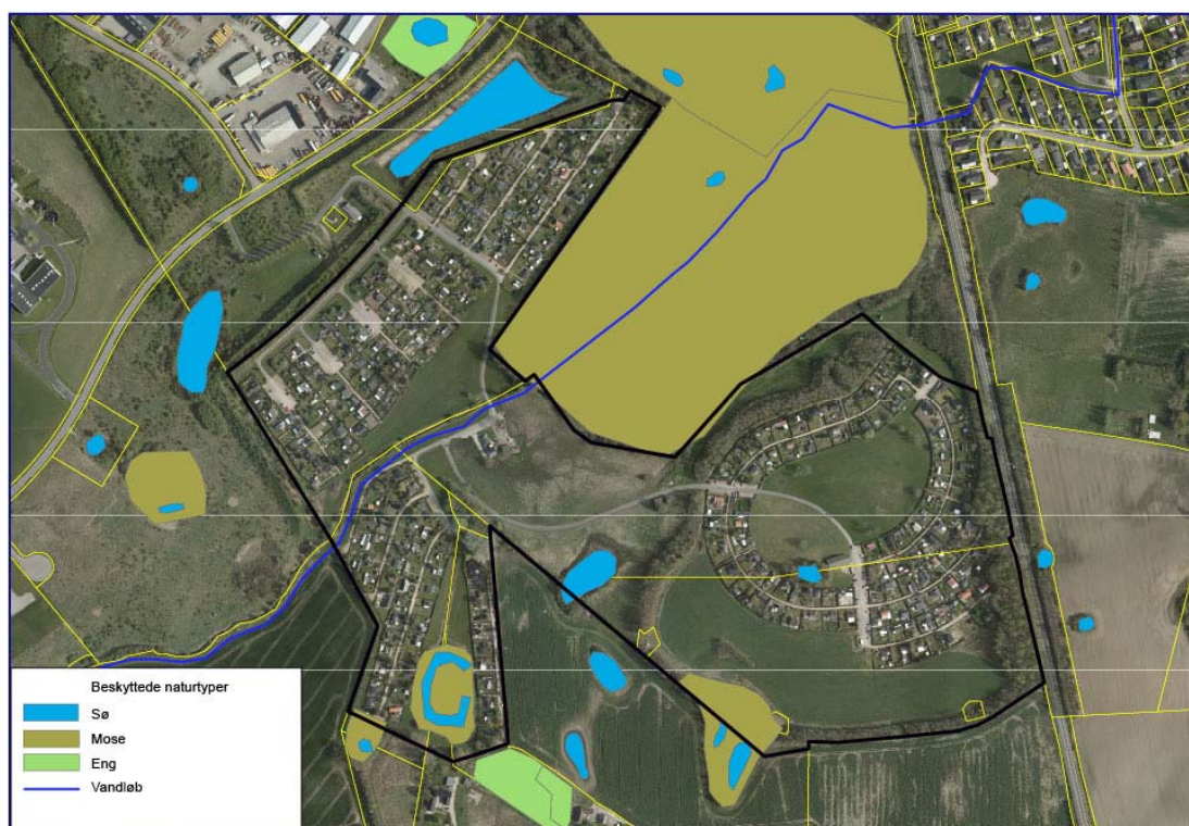
2 Kort over beskyttede naturtyper

Området for Lokalplansforslaget ligger overvejende i OSD område og delvist i OD område. Det vurderes at lokalplansforslaget ikke vil have en negativ effekt på grundvandet. Dele af området for Lokalplansforslaget er af Staten udpeget som Nitratfølsomt og Boringsnære Beskyttelsesområder (BNBO).