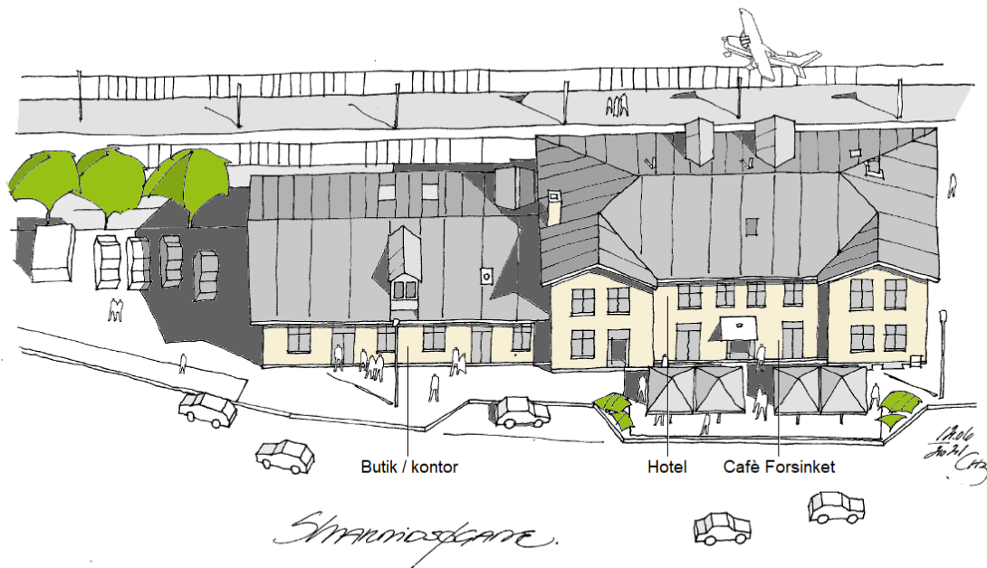
Transformation af den gl. stationsbygning i 4450 Jyderup.