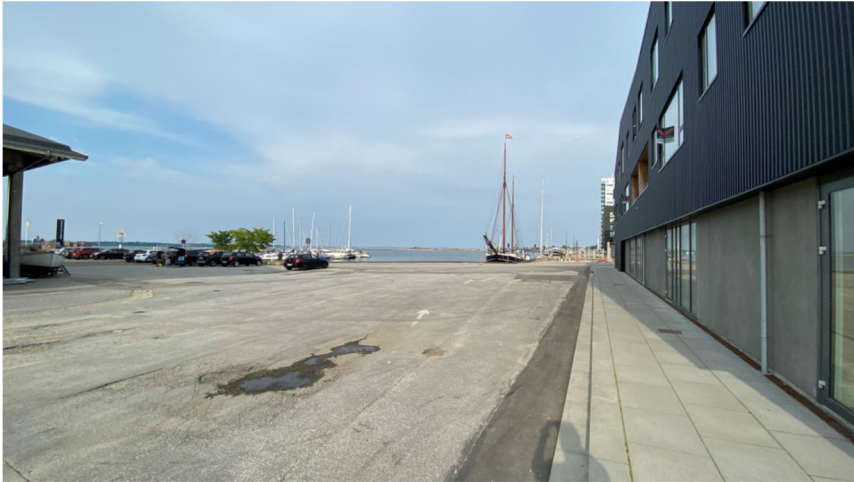
Fotoreferencer fra Ålborg, indsendt med høringsvar nr. 3: